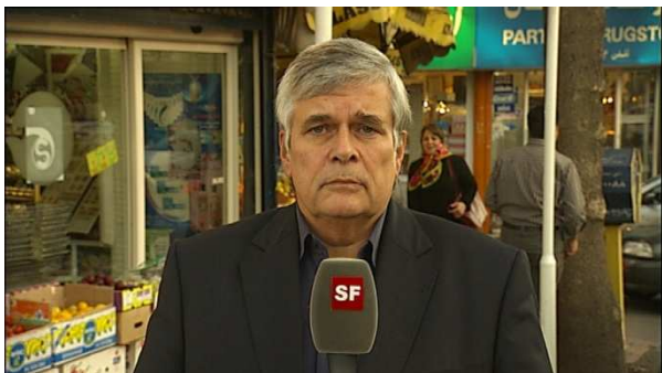
Ulrich Tilgner, Korrespondent Schweizer Fernsehen